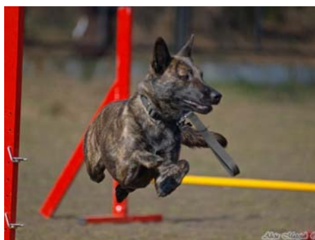
Itske v.d. S- Gravenschans

Posiadanie owczarka holenderskiego ma niezaprzeczalną zaletę: zmusza właścicieli do prowadzenia zdrowego i aktywnego trybu życia oraz poprawia atmosferę domową, bo przy tym psie nie może być konfliktów. Stado z ludzkim przewodnikiem ma żyć w harmonii, chronione przez pręgowaną „hienę”.