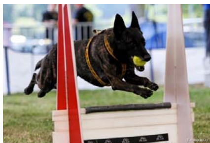
Galxy Oalt Mercator