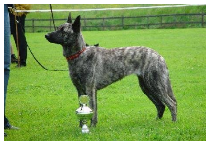
Iente van het Pullenland champion Holandii 2008

Nestendag - przegląd Klubowy NHC 19. 10. 2008 r