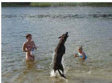
Itske v.d. S-Gravenschas jako pies rodzinny

czy owczarki niemieckie, jest na to zbyt wymagający, ale w Europie stale poszerza grono zwolenników jako pies sportowy i towarzyszący.