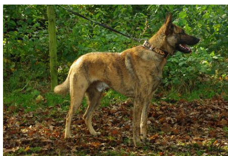
Onno van het Oude Landras

W USA i Anglii hodowane są owczarki holenderskie prawie lub całkowicie czarne, sylwetką zbliżone do owczarka niemieckiego, z dość długim tułowiem i większym kątowaniem, uszy są raczej niezgodne ze wzorcem.