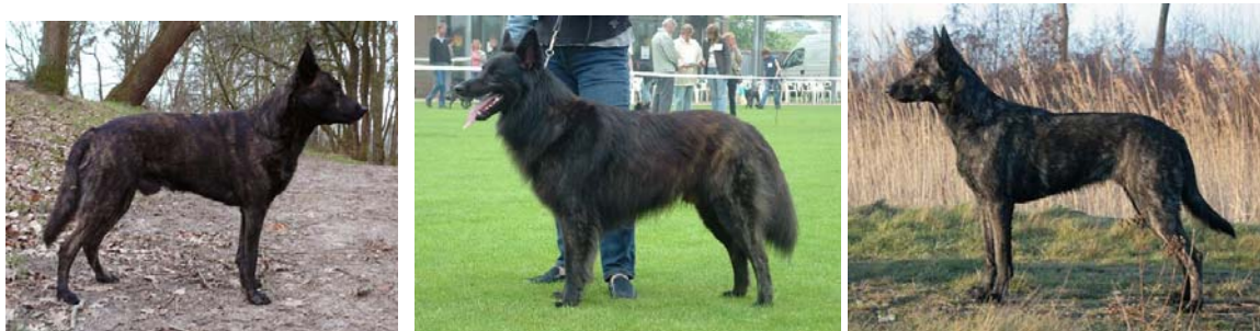
CO van de Molengos champion Holandii 2006 / Mijn Joran's Luka van de Sylvester Stee champion Holandii 2009 / Kara v.d 's Gravenschans chamion Niemiec 2008

Wśród psów, które otrzymują tytuł championa (CACIB, BOB) przeważają psy dość ciemne, złoto pręgowane.