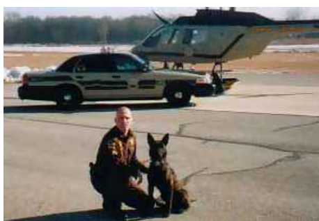
USA, Baden K-9