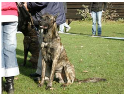
pies o nietypowej głowie

Nestendag - przegląd Klubowy NHC 19. 10. 2008 r