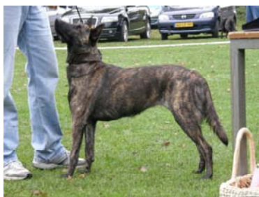
Itske v.d. S- Gravenschans młodzieżowy champ. Polski 2008